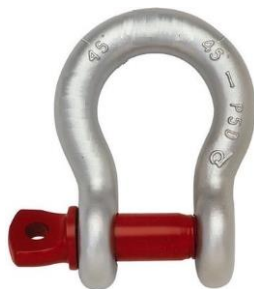
grillo omega perno a vite ns.rif. 0107