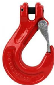
gancio a forcina con sicura ns.rif. 0503