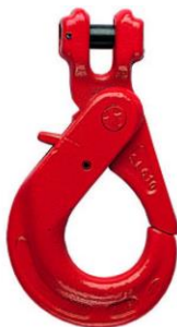
gancio SelfLocking a forcella ns.rif. 0513